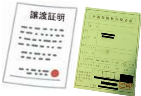
介護保険被保険者証