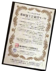
マイクロチップデータ登録完了通知書