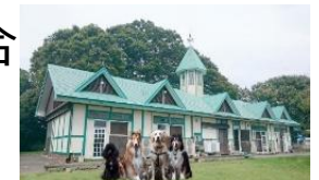
ペットシェルター 12