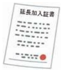
マイクロチップデータ登録完了通知書