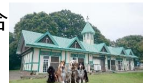
ペットシェルター 12